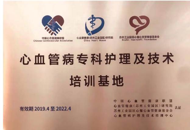
心血管病专科护理及技术培训基地