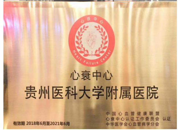
获批中国心衰中心