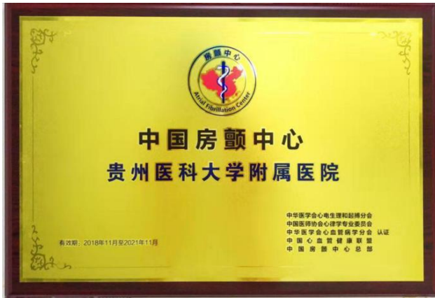
获批中国房颤中心