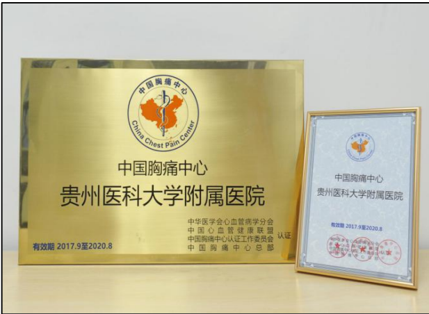
获批中国胸痛中心